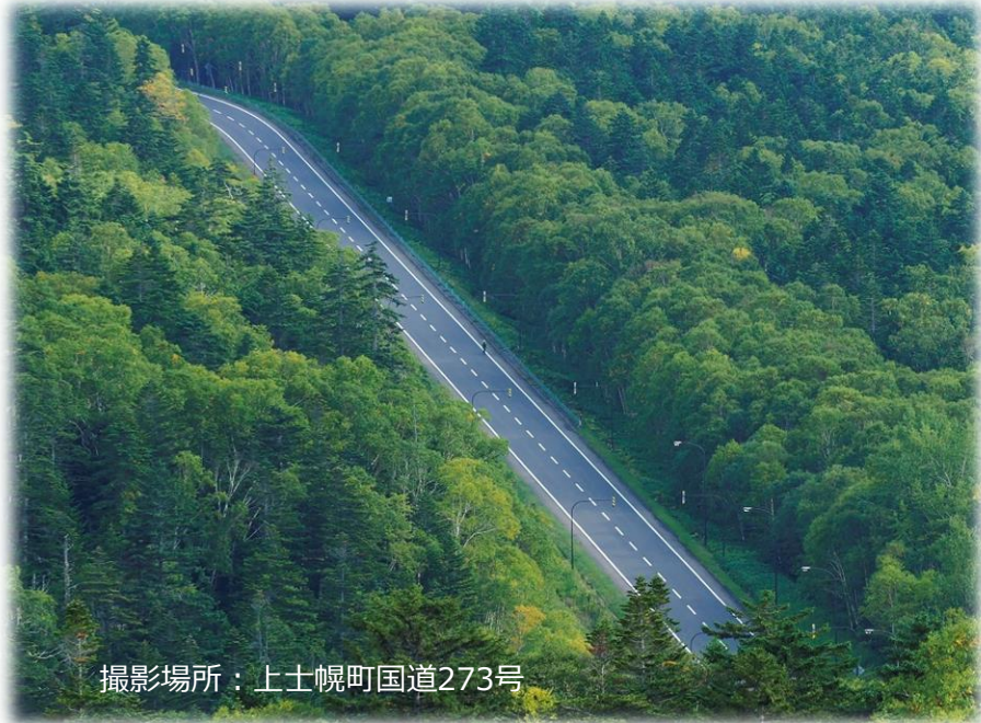
撮影場所：上士幌町国道273号